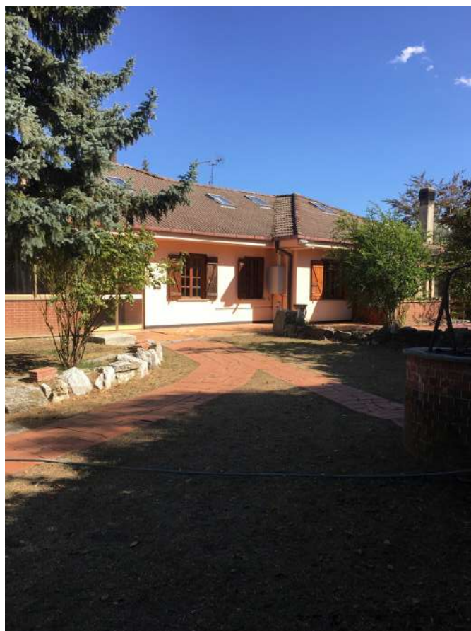
Esterno del Gruppo Appartamento

Tel. 3888538220 - 3917230879 e-mail: lacoccinella@21coop.it